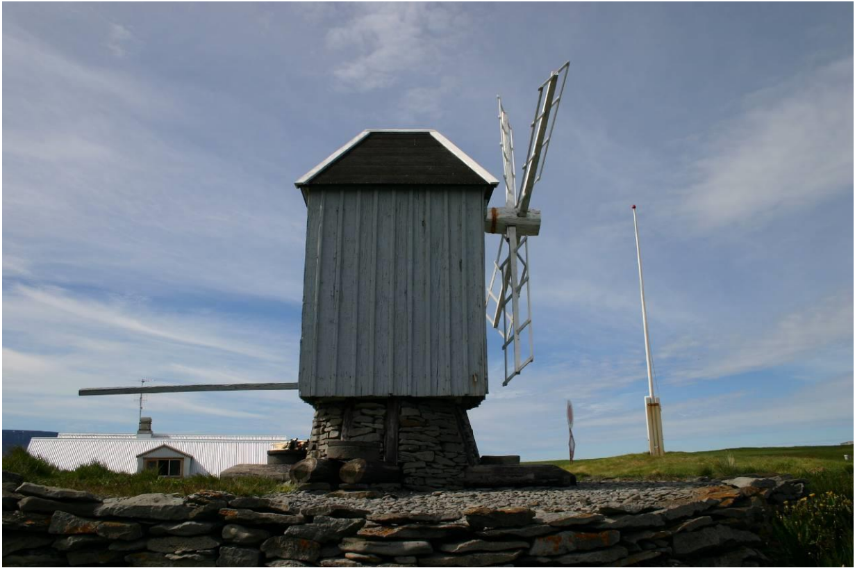
Vindmyllan í Vigur. GLH 2004.