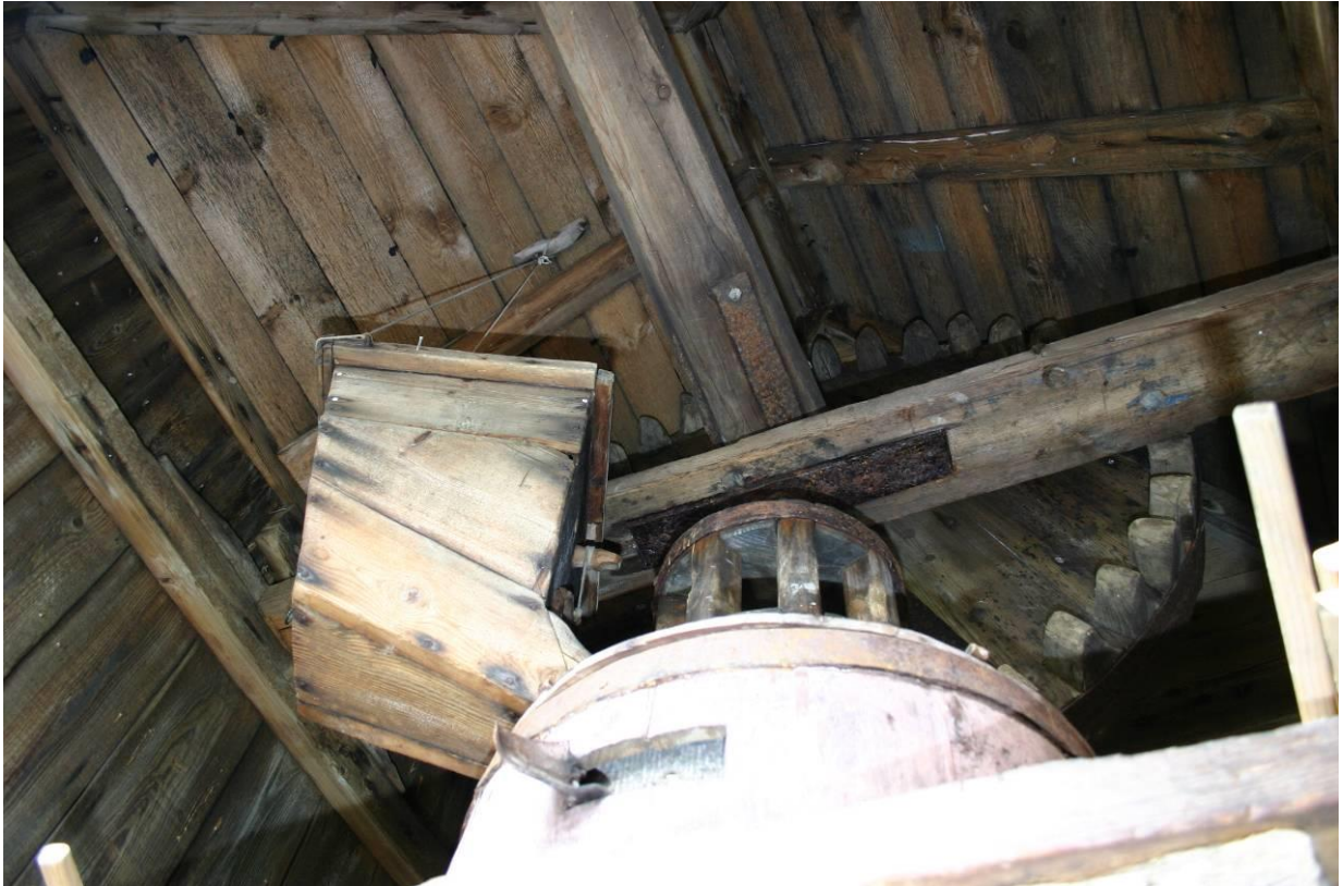
Vindmyllan, horft inn í myllubúsið. GLH 2004.