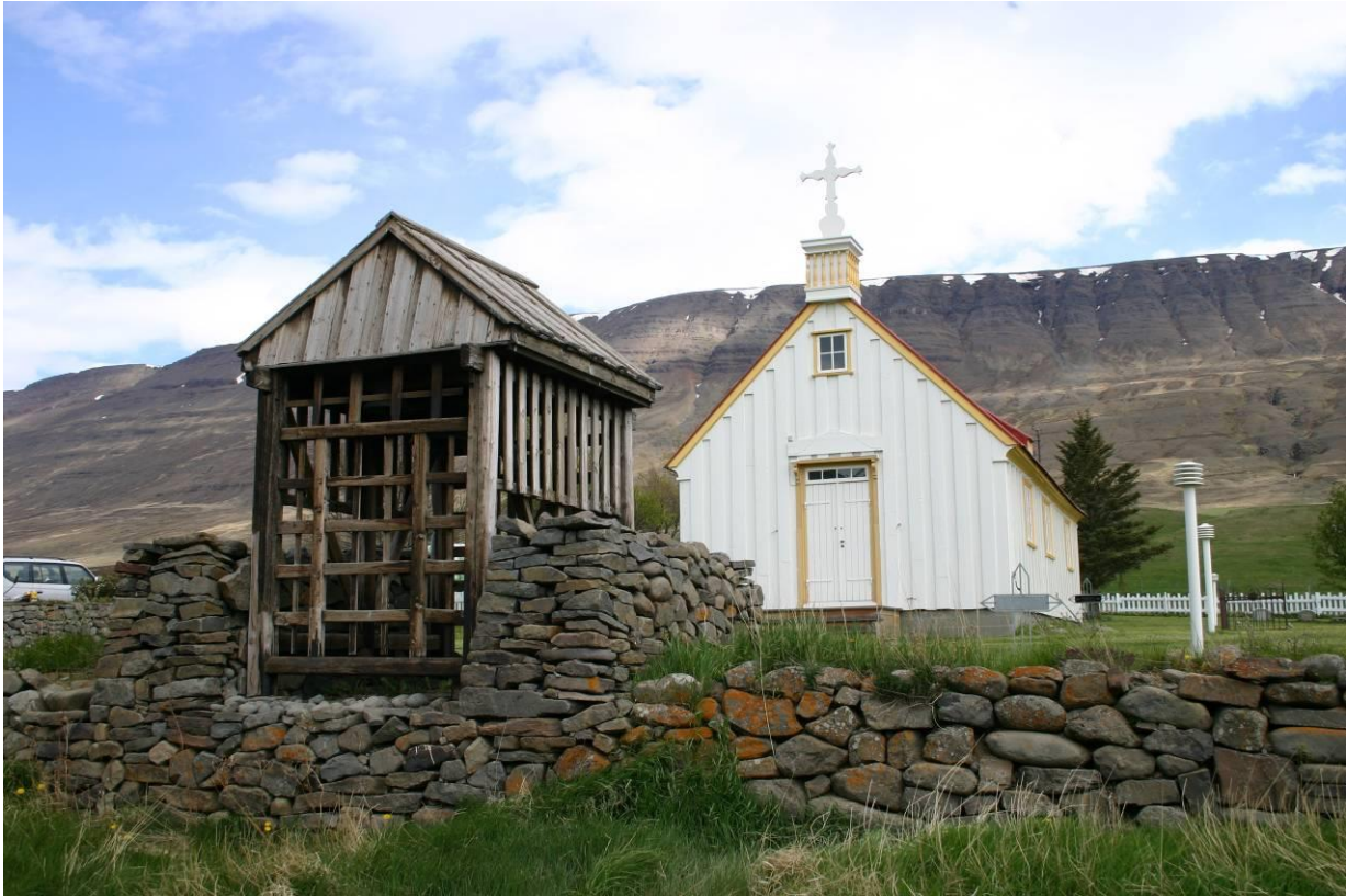
Klukknaportið á Möðruvöllum. GLH 2005.