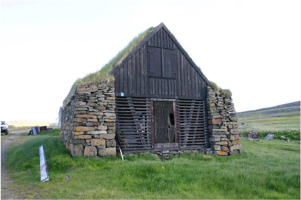
Hjallur í Vatnsfirði. GLH 2004.