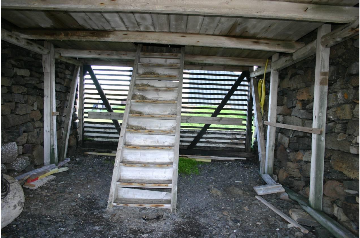
Hjallur í Vatnsfirði. GLH 2004.