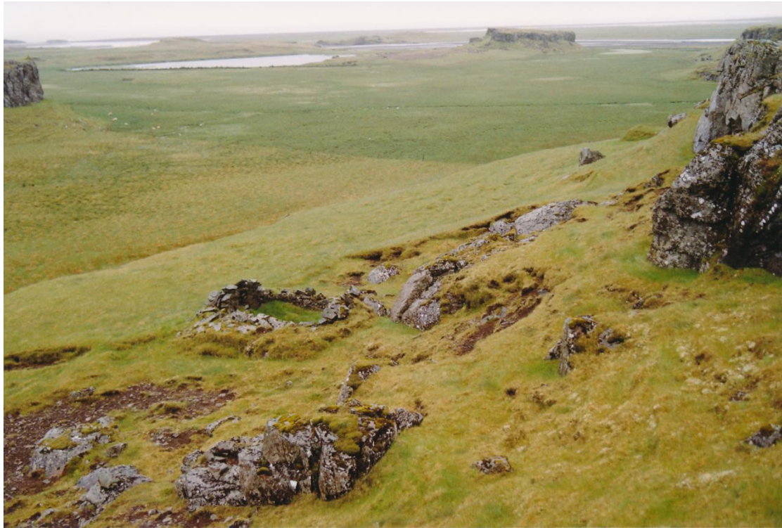
Mynd 10. Horft til suðurs yfir rúst 2 (GÓL-1998-4-17).