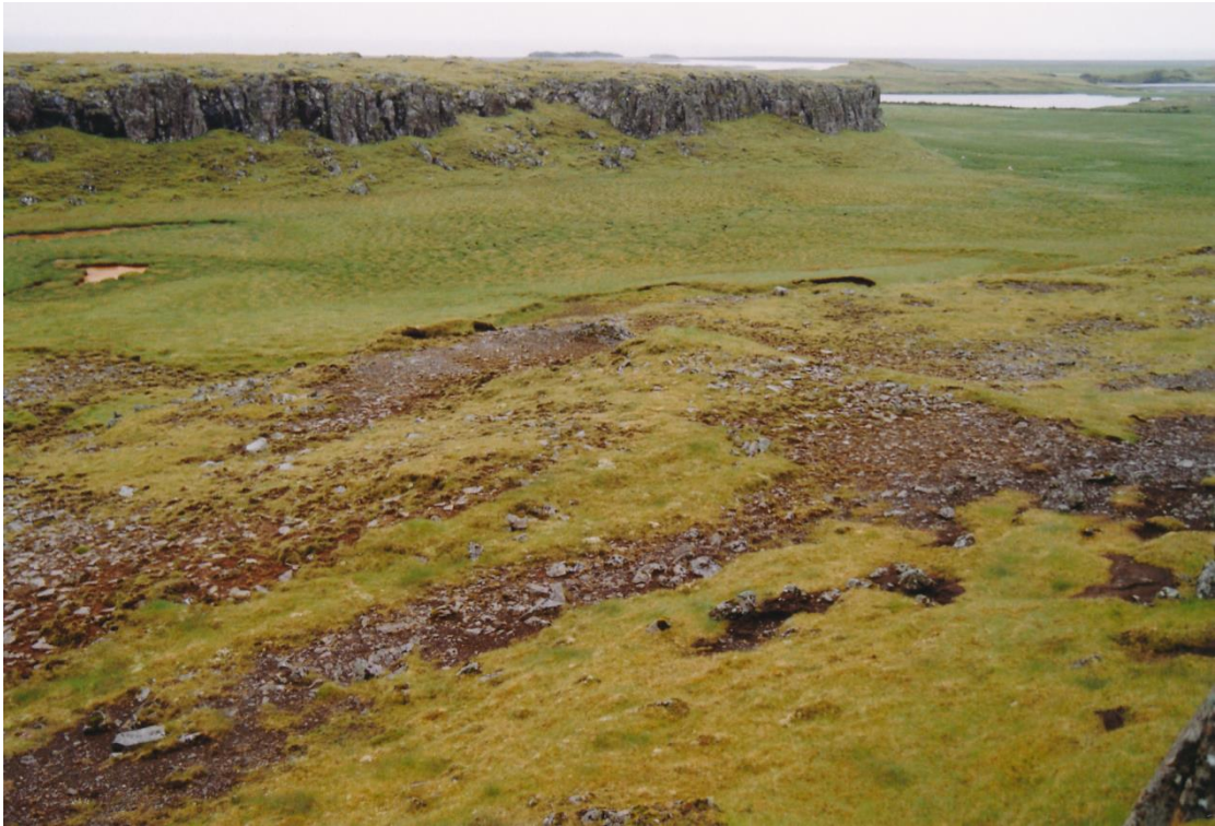
Mynd 4. Horft til suðurs yfir uppblásnar rústirnar. Greina má garðlag sem liggur á ská neðst frá hægri inn að miðju myndarinnar. Til hægri liggja veggjabrot B og F þvert á garðinn. Þústin á svæði A er á miðri mynd (GÓL-1998-4-16).

Veður var mjög óhagstætt til teiknivinnu, rok og mikil rigning. Sóttist því verkið mun verr en ella og tók hátt í þrjár klukkustundir.