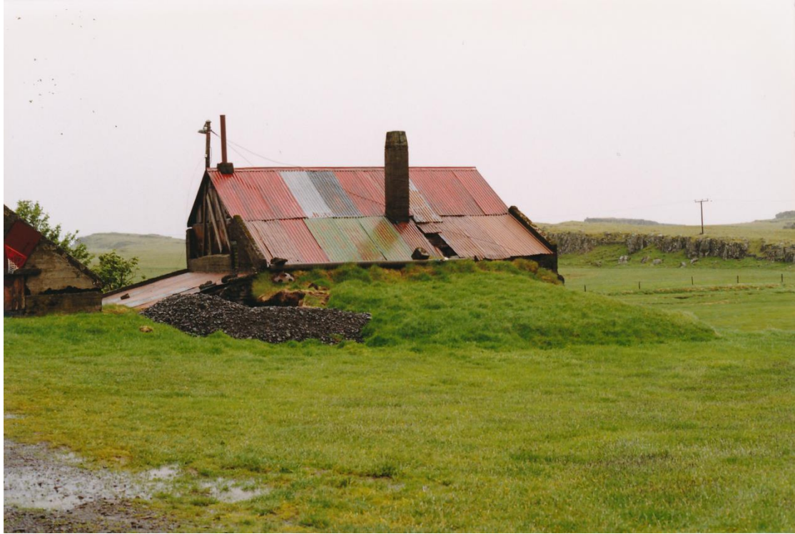
Mynd 2. Gömul útihús á Vagnsstöðum (GÓL-1998-4-2).