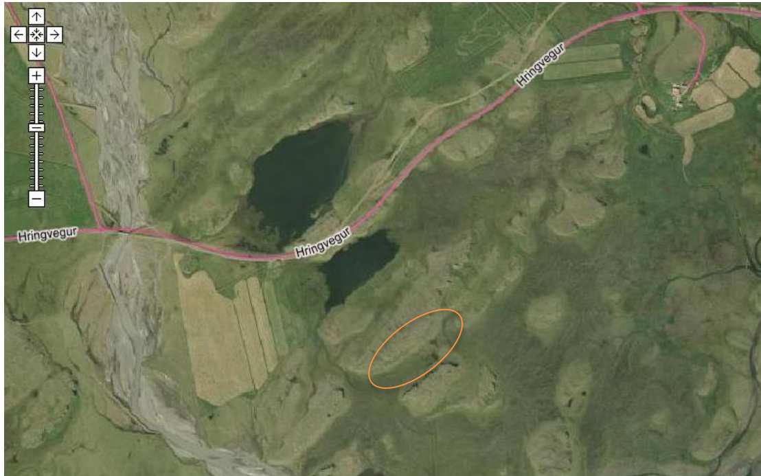
Mynd 1. Loftmynd af svæðinu. Minjarnar eru innan sporbaugsins. Vagnsstaðir eru efst til hægri.