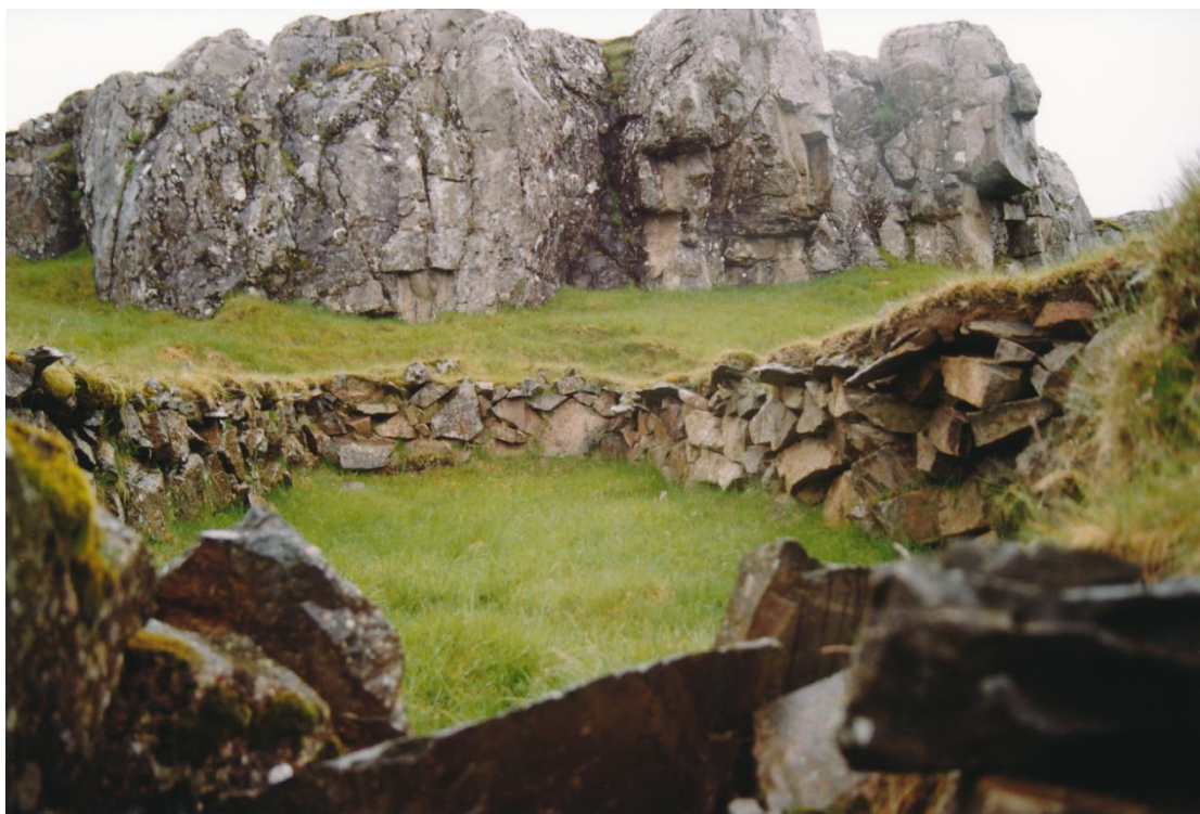
Mynd 12. Hort til norðurs yfir rúst 3 (GÓL-1998-4-25).