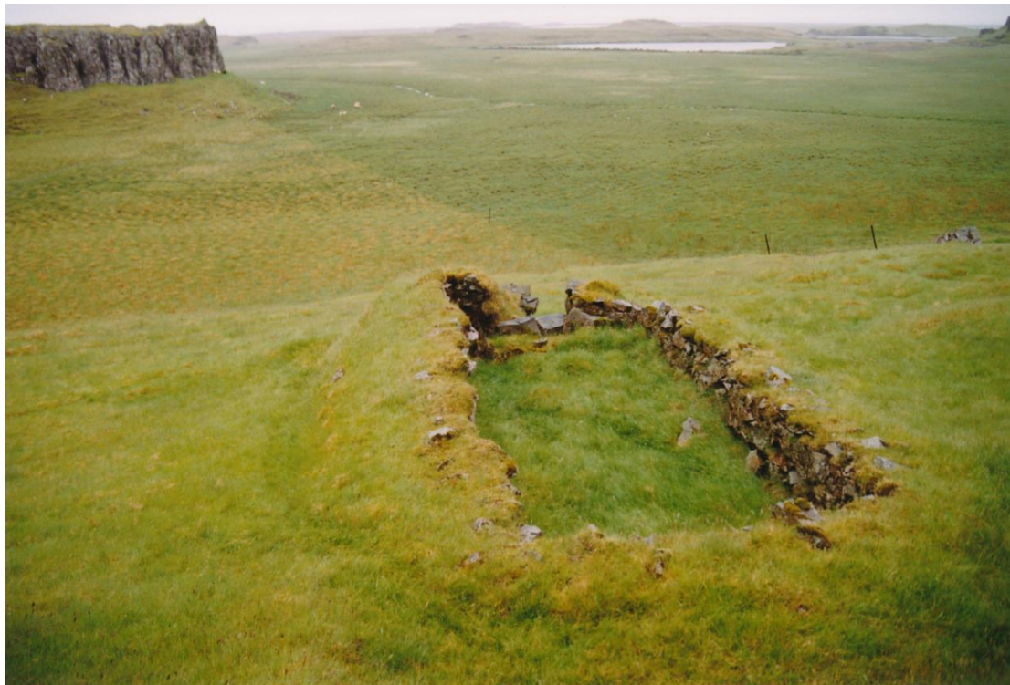
Mynd 11. Horft til suðurs yfir rúst 3 (GÓL-1998-4-23).