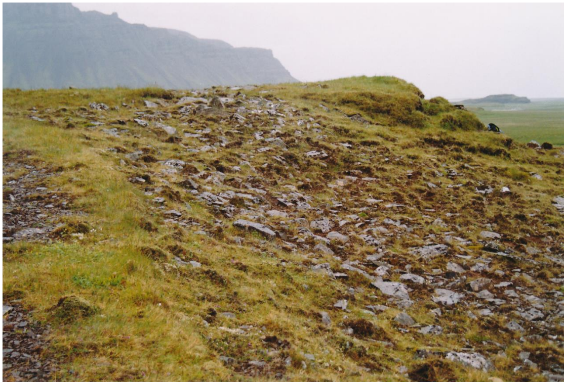
Mynd 7. Horft til norðausturs. Grasröndin til vinstri er hugsanlega leifar af vegg á svæði G. Þústinn ofarlega til hægri er svæði A og syðst á því er rofabarðið sem er að brotna framan af þústinni (GÓL-1998-4-18).