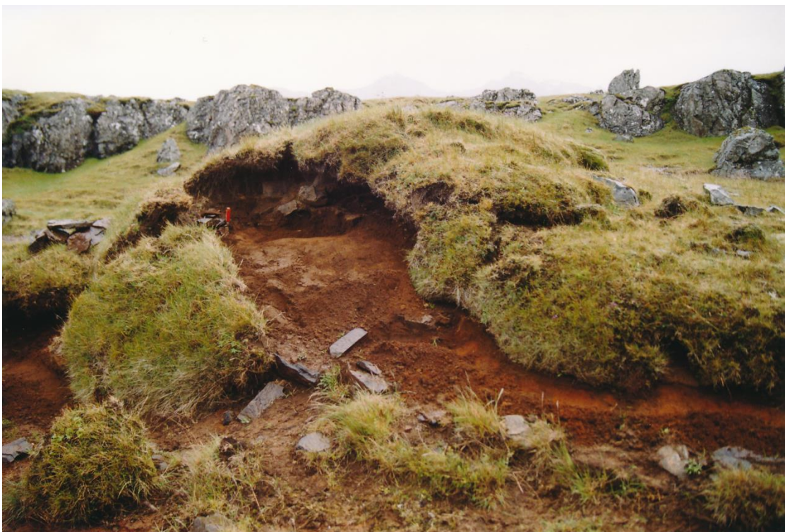
Mynd 5. Rofabarð syðst á svæði A, þar sem fundust leifar dýrabeina og hleðslubrot (GÓL-1998-4-5).

Veður var mjög óhagstætt til teiknivinnu, rok og mikil rigning. Sóttist því verkið mun verr en ella og tók hátt í þrjár klukkustundir.