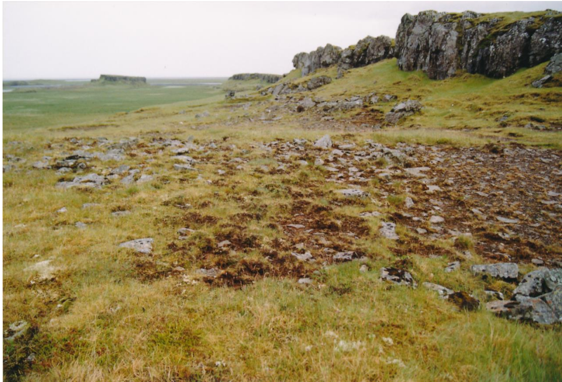
Mynd 6. Horft til vesturs yfir norðurhluta rústasvæðisins. Steinarnir sem sjást á uppblásnu flötinni eru leifar úr veggjum og gólfum. Neðst til hægri er svæði I (GÓL-1998-4-6).