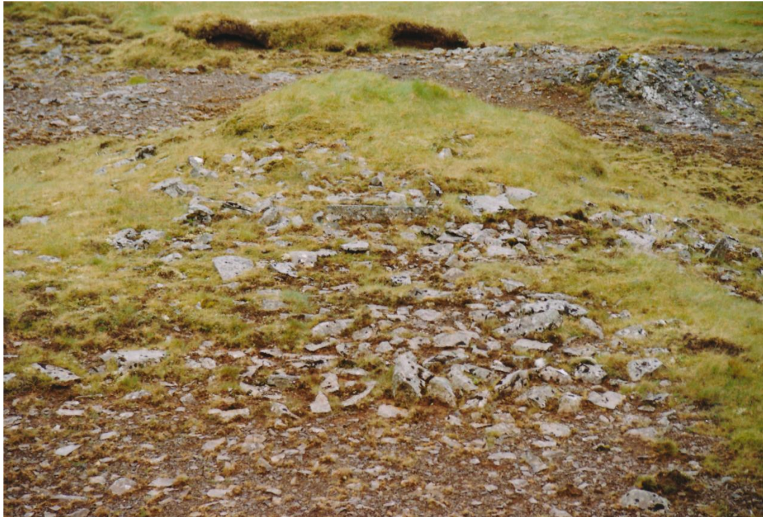
Mynd 8. Horft til suðurs yfir leifar af veggjahleðslum og gólfhellum á svæði H, fremst á myndinni, svæði C á miðri mynd og svæði D sem er þar fyrir ofan. Efst er svæði A og til hægri er svæði F (GÓL-1998-4-10).

Mjög erfitt var að átta sig á upphaflegu útliti bæjarins sem þarna hefur staðið. Leifar af óljósum hleðslum og bútar af steinaröðum gáfu vísbendingar um leifar veggja sem nú voru að mestu horfnir. Aðrir steinar virtust hafa verið gólfhellur. Ef miðað er við ystu mörk sýnilegra hleðsluleifa má ætla að bærinn hafi að minnsta kosti verið um 15 m langur og 7 m breiður. Hann hefur legið með hlíðinni og hefur snúið langhliðum nánast í norður – suður.